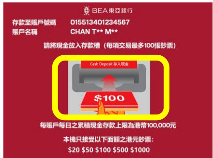
核对存款账户及账户名称后， 将现金放入存款槽