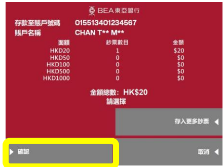
核对存款金额后，按「确认」