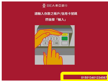
输入存款账户号码